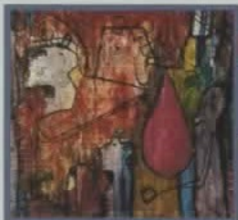
Cristóbal Peña y Lillo