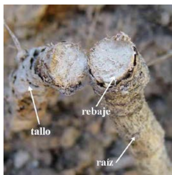
Fig. 5. Raíz de Cerithe major , trabajada por la larva de Phytoecia malachitica .

Datos de captura: 1 ♂, 1 ♀, 23/01/2012 ; 12 ♂♂, 10 ♀♀ 26/01/2012. Jerez de la Frontera, Cádiz , España. Altitud de 21 m. sobre el nivel del mar; cuadrícula UTM 29SQA56. A. Verdugo leg. y coll.