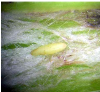
Fig. 3. Huevo de la especie

De poblaciones poco numerosas presenta una emergencia muy temprana, al menos en la provincia de Cádiz, desde finales de diciembre hasta la mitad de febrero (Verdugo & Hernández, 2001) algo más tarde en las poblaciones más al norte. Murria Beltrán (1998 y 2001) menciona que viven durante marzo y abril en Zaragoza. Las cópulas y puestas de huevos se realizan durante enero y febrero en Cádiz (Fig. 3) con un desarrollo larvario rápido durante la primavera y el verano (Fig. 4) y pudiéndose encontrar los adultos ya formados en la celda pupal al final de este. La larva cuando esta próxima a completar su desarrollo realiza mediante sus mandíbulas un rebaje interno del cuello de la raíz, más o menos al nivel del suelo, con objeto de favorecer la rotura y caída del tallo una vez seco, con la finalidad de proteger la raíz con su inquilino (Fig. 5). Sus fitohuéspedes son diversas especies de la familia Boraginaceae, entre los que se cuentan los géneros Cerithe , Cynoglossum , Anchusa y Echium , habiendo sido localizada en la provincia de Cádiz sobre los dos primeros géneros, especialmente Cerithe major y Cynoglossum clandestinum .