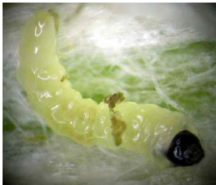
Fig. 4. Larva de primera edad