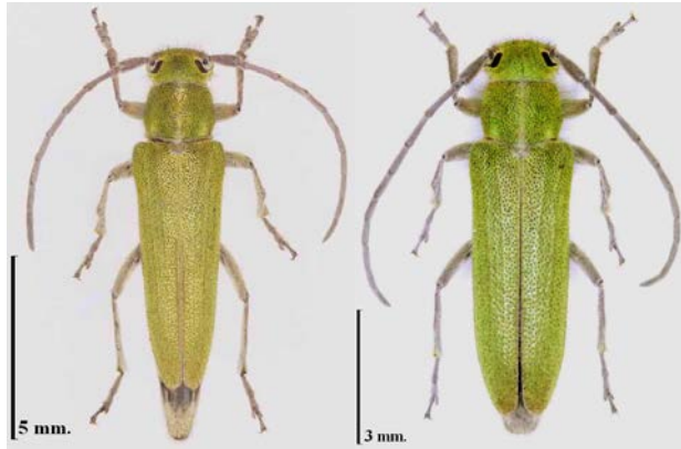
Fig. 1. Hábitus de Phytoecia malachitica Lucas. A la izquierda el macho, a la derecha, la hembra.

Verdugo, A. Nuevo registro de Phytoecia malachitica Lucas, 1849 (Coleoptera: Cerambycidae: Lamiinae) para la provincia de Cádiz, España.